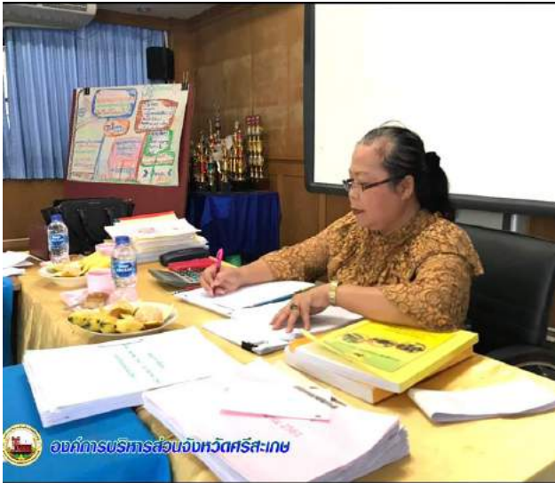
องค์การบริหารส่วนจังหวัดศรีสะเกษ