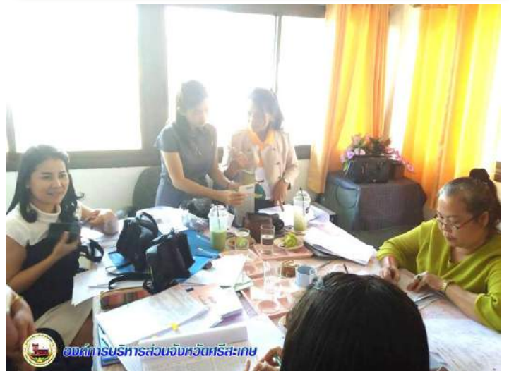
องค์การบริหารส่วนจังหวัดศรีสะเกษ