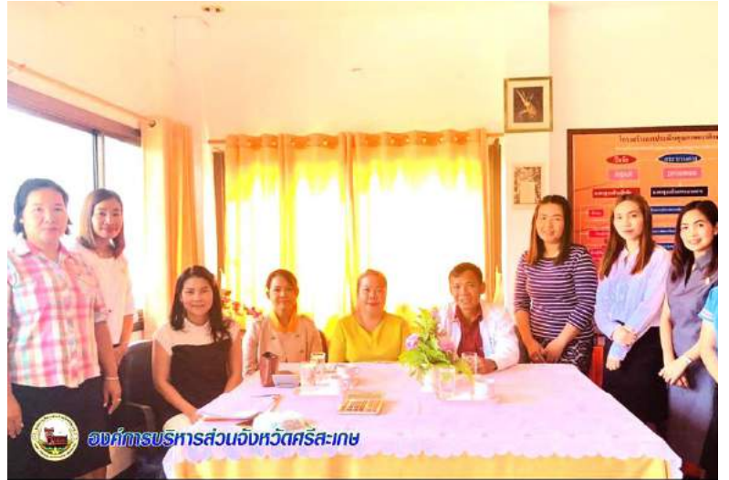
องค์การบริหารส่วนจังหวัดศรีสะเกษ